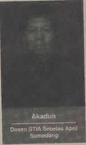
Akadun Dosen STIA Sebelas April Sumedang

Tidak sedikit juga keluarga di Indonesia di mana pola wicara, pola sikap dan pola tindak anggota keluarga mendemonstrasikan dan mempertontonkan kekerasan (kata lain dari terorisme). Tindakan kekerasan sering terjadi di lingkungan keluarga berupa kekerasan bahasa (kata-kata kasar seperti anjing, babi, bodoh, kurang ajar), kekerasan sikap (membiarkan terjadinya kekerasan di keluarga, membiarkan anak melihat dan menonton kekerasan baik langsung atau melalui media), kekerasan tindakan